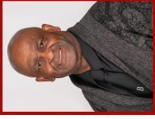
Rdl John Fredericks Mayco: Korporatiewe & Finansiële Dienste PV (VF+)