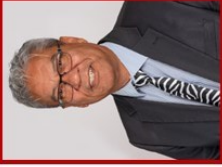
Raadsheer Karriem Adams Mayco: Behuising WYK 6 (DA)