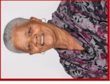
Rdl Lea Hardnek MPAC, PV (WP)